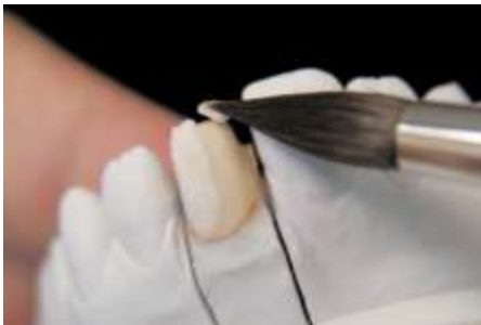
10. Opakdentyna nakładanie OB (0.3mm)