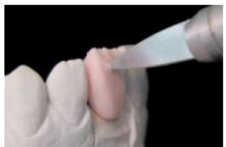
21. Sprawdzenie grubości dentyny (>0.8)