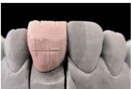
16. Ścięcie (1/3 od brzegu)