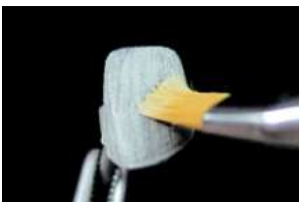
4. Opaker 1-sza warstwa (wash)