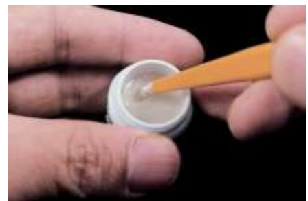
3. Nabranie opakera w paście