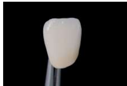
27. I-sze palenie/ lekki połysk