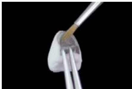
26. Sprawdzenie środka