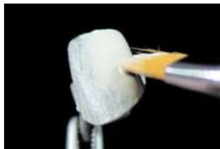
5. Opaker 1-sza warstwa (pokrycie)