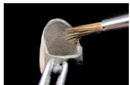
6. Sprawdzenie wnętrza