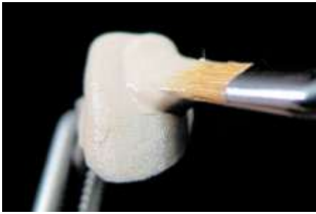
7. Opaker 2-ga warstwa