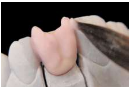
13. Nałożenie dentyny