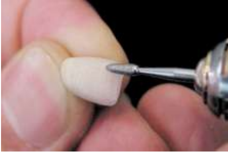
38. Drobne linie/detale (DP-02)