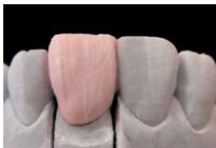
14. Uformowanie dentyny