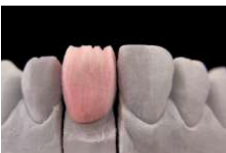
20. Mamelony - uformowanie