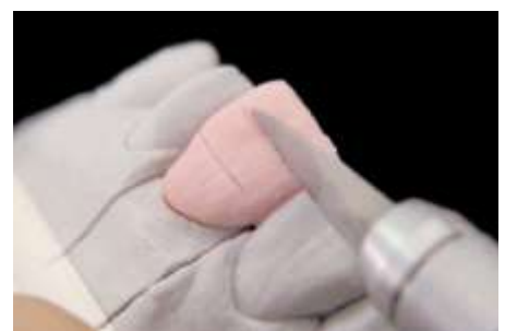
15. Ścięcie - zaznaczenie linii