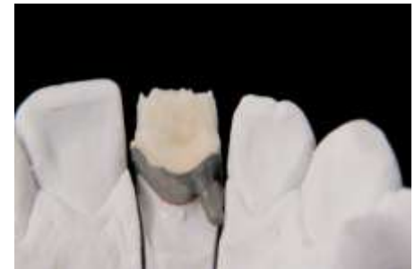
12. Strona językowa