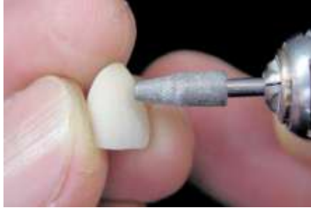
37. Nacięcie rowków