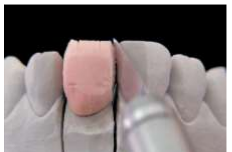
18. Ścięcie (na styčných)