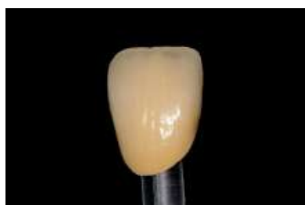
32. Widok końcowy