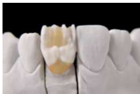
29. Creamy Enamel