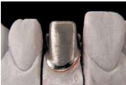
1. Metal - dopasowanie