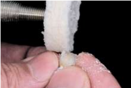
41. Polerowanie (pearl surface C)