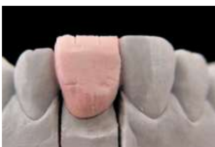
17. Ścięcie (środek)