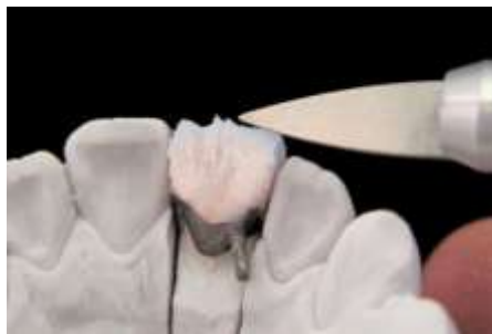
23. Bez szkliwa po str. językowej