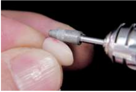
36. Dopasowanie (DP-05)