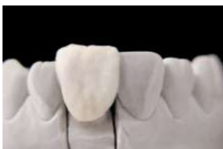
31. CCV-1 / CCV-2