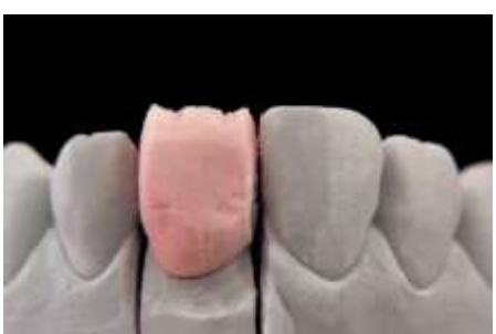
19. Mamelony - nacięcie