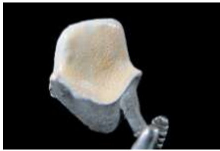
8. Opaker - modyfikacja