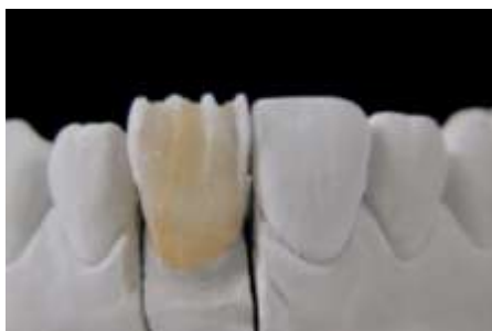
28. T-Blue (krawędź) LT0 (mamelon)