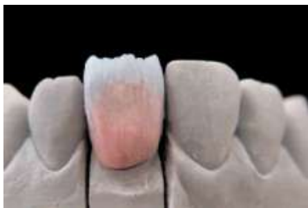
22. Nałożenie szkliwa (enamel)