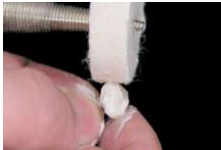
42. Polerowanie (pearl F)